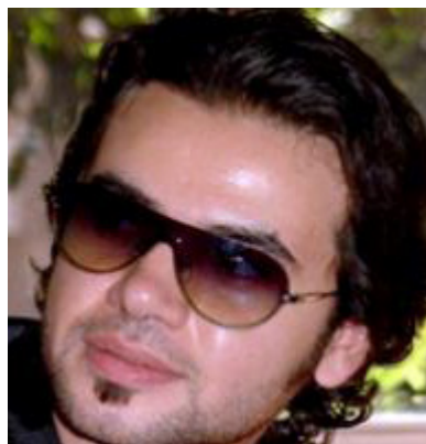
SAMO ZAIN سامو زين

تأمين زيارة الفنانين العرب الى المهرجان كالفنان باسم ياخور و الفنان ماجد المصري و الفنان عادل امام و مجموعة من الفنانين العراقيين