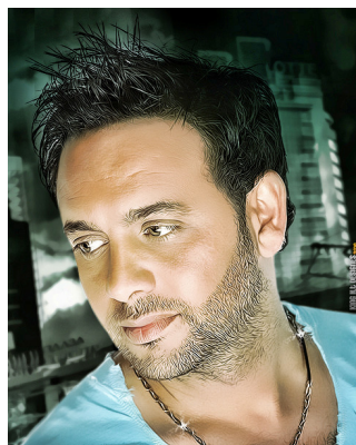
MUSTAFA KAMAR مصطفى قمر

اقامة حفلات غنائية للفنانين اللبناني سامو زين و المصري مصطفى قمر